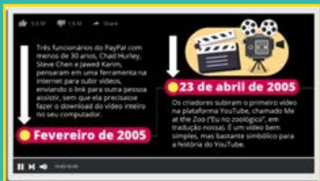
Objetos de Aprendizagem