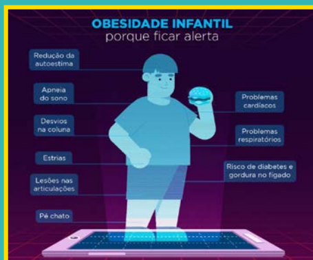
Objetos de Aprendizagem