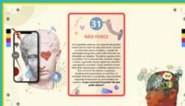
Objetos de Aprendizagem