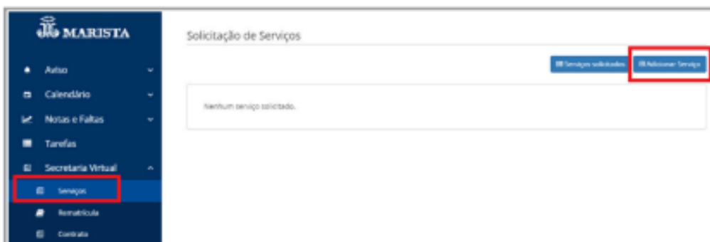
Figura 3 – Imagem apresentada para o Responsável Financeiro no momento de adicionar os Componentes Curriculares Optativos.