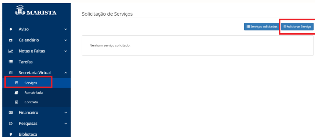
Figura 3 – Imagem apresentada para o Responsável Financeiro no momento de adicionar os Componentes Curriculares Optativos.