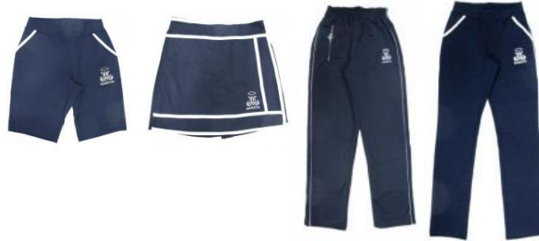
Moletom / Helanca