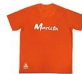
Integral Marista (1º ao 5º ano)