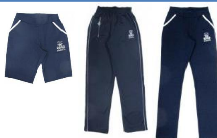
Moletom / Helanca