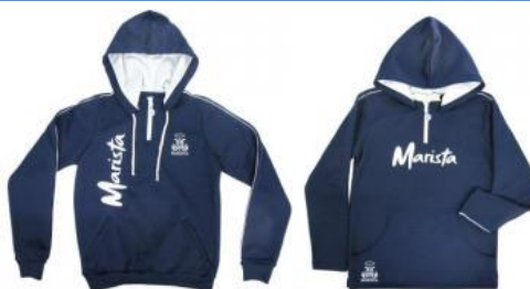
Moletom / Helanca