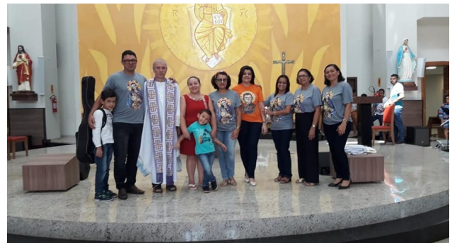
A Fraternidade Nossa Senhora da Conceição, de Balsas-Maranhão, esteve reunida no dia 30/11/2019, para preparar a liturgia de domingo, na Catedral Sagrado Coração de Jesus.